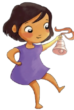
Catalina D. R. © 2023, CMT